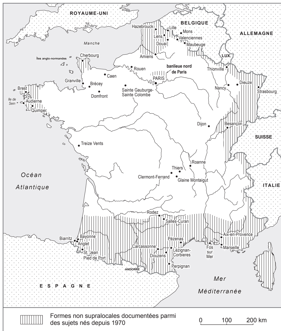
Figure 2 Régions où des locuteurs nés depuis 1970 emploient des variantes non supralocales de façon variable

Nous avons vu que les traits proprement dialectaux qui permettaient d'identifier ce qu'on appelle parfois les français régionaux, ne s'entendent quasiment pas dans la bouche de locuteurs nés depuis 1970 et toutes les variantes françaises considérées comme marques régionales sont en fort recul. Mais certaines de ces variantes ( a postérieur ; o fermé en syllabe entravée) ont pris une valeur identitaire dans des conditions particulières – un phénomène documenté ailleurs dans la littérature sociolinguistique (e.g. Moore 2010 en Angleterre). Nous avons souligné par exemple la différenciation parmi les groupes de jeunes multi-ethniques à Lille.