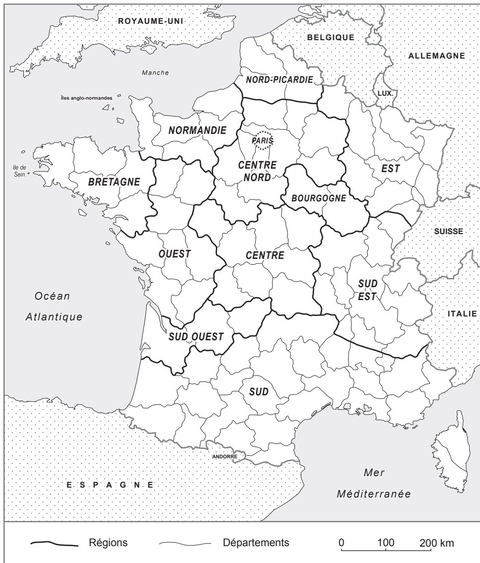
Figure 1 Répartition géographique des accents des hommes des classes moyennes en 1941 (Martinet, 1945)

Déjà dans les années 1940, la première étude sociolinguistique consacrée à la variation régionale (Martinet 1945) montre des indices de supralocalisation. Les témoins, officiers, prisonniers de guerre (donc des hommes des classes moyennes et supérieures et nés entre 1880 et 1920), ont été répartis suivant leur région d'origine (Figure 1). On remarque peu de différences entre les sujets parisiens et ceux qui étaient originaires du centre nord. Les témoins mobiles qui avaient changé plus d'une fois de région au cours de leur jeunesse signalaient eux aussi peu de différences avec les deux premiers groupes dans la perception de leur prononciation. Les sujets bretons et alsaciens ne se distinguaient pas de leurs camarades